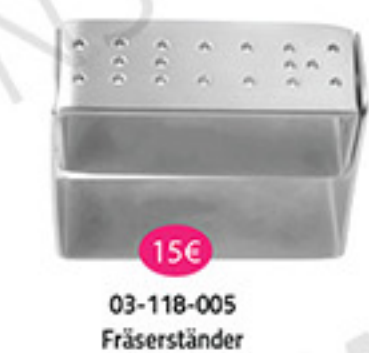
03-118-005 15€ Fräserständer 05-280-B 12€ Skapellklingen 100 Stück