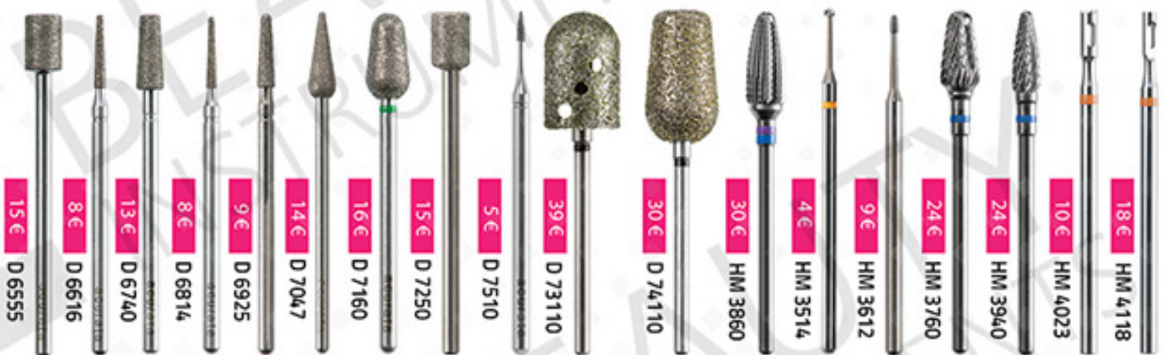
15€ D 6555 8€ D 6616 13€ D 6740 8€ D 6814 9€ D 6925 14€ D 7047 16€ D 7160 15€ D 7250 5€ D 7510 39€ D 73110 30€ D 74110 30€ HM 3860 4€ HM 3514 9€ HM 3612 24€ HM 3760 24€ HM 3940 10€ HM 4023 18€ HM 4118