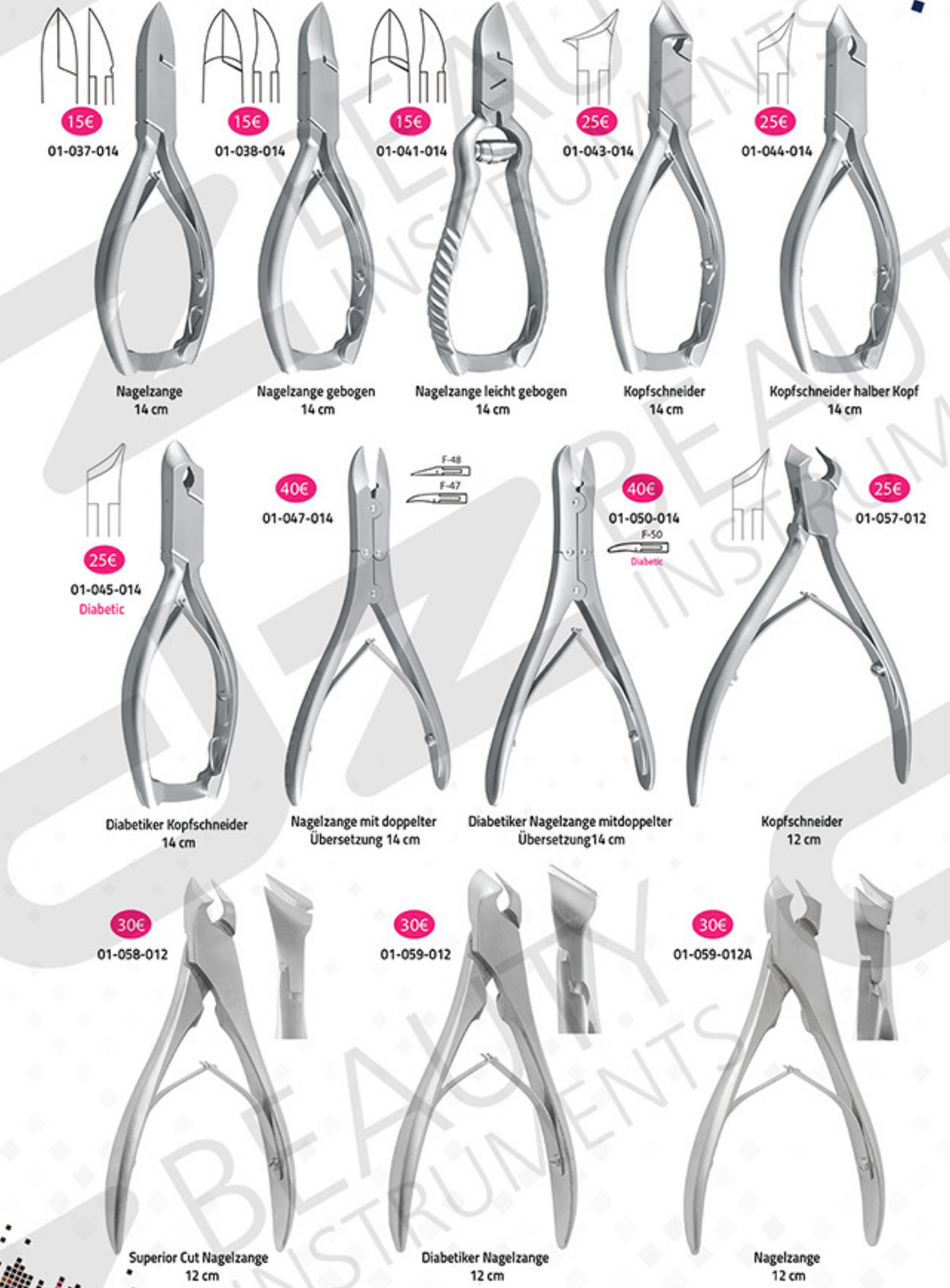
01-037-014 15€ Nagelzange 14 cm 01-038-014 15€ Nagelzange gebogen 14 cm 01-041-014 15€ Nagelzange leicht gebogen 14 cm 01-043-014 25€ Kopfschneider 14 cm 01-044-014 25€ Kopfschneider halber Kopf 14 cm 01-045-014 25€ Diabetic 01-047-014 40€ Nagelzange mit doppelter Übersetzung 14 cm 01-050-014 40€ Diabetic 01-057-012 25€ Diabetic 01-058-012 30€ Superior Cut Nagelzange 12 cm 01-059-012 30€ Diabetiker Nagelzange 12 cm 01-059-012A 30€ Diabetiker Nagelzange mitdoppelter Übersetzung 14 cm 01-059-012A 30€ Nagelzange 12 cm