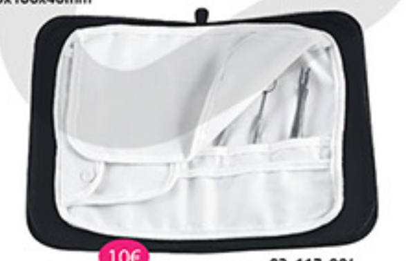
03-117-004 10€ Kunstleder-Etui