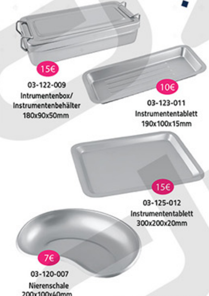
03-122-009 15€ Instrumentenbox/ Instrumentenbehälter 180x90x50mm 03-123-011 10€ Instrumententablett 190x100x15mm 03-125-012 15€ Instrumententablett 300x200x20mm 03-120-007 7€ Nierenschale 200x100x40mm