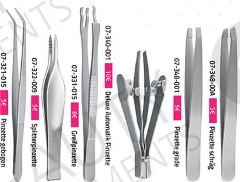
07-340-001 10€ Deluxe Automatik Pinzette 07-331-015 8€ Greifpinzette 07-322-009 5€ Splitterpinzette 07-321-015 5€ Pinzette gebogen 07-348-001 5€ Pinzette grade 07-348-00A 5€ Pinzette schräg