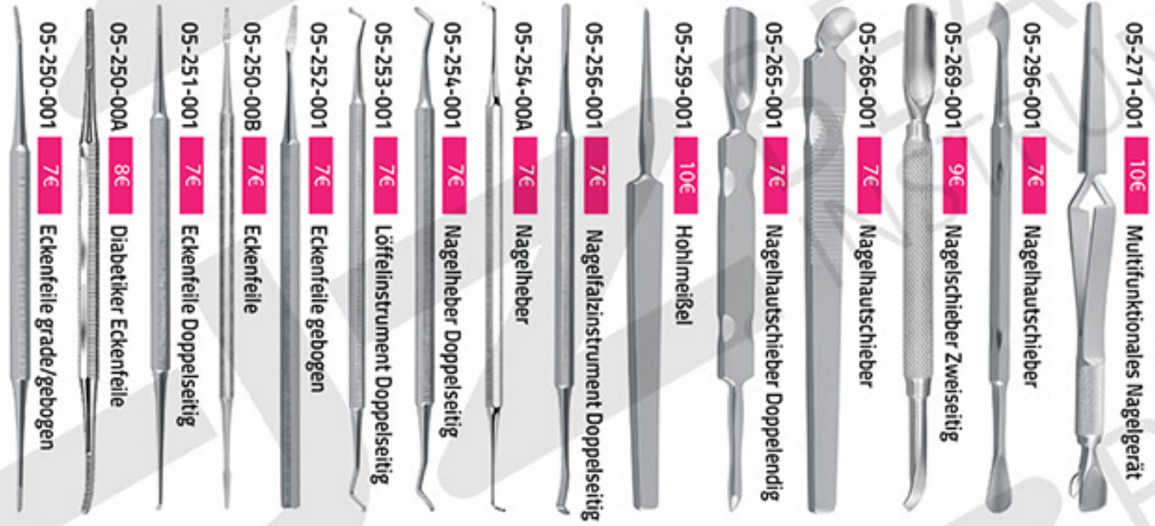
05-250-001 7€ Eckenfeile gerade/gebogen 05-250-00A 8€ Diabetiker Eckenfeile 05-251-001 7€ Eckenfeile Doppelseitig 05-250-00B 7€ Eckenfeile 05-252-001 7€ Eckenfeile gebogen 05-253-001 7€ Löffelinstrument Doppelseitig 05-254-001 7€ Nagelheber Doppelseitig 05-254-00A 7€ Nagelheber 05-256-001 7€ Nagelfalzinstrument Doppelseitig 05-259-001 10€ Hohlmeißel 05-265-001 7€ Nagelhauschieber Doppellendig 05-266-001 7€ Nagelhauschieber 05-269-001 9€ Nagelschieber Zweiseitig 05-296-001 7€ Nagelhauschieber 05-271-001 10€ Multifunktionales Nagelgerät